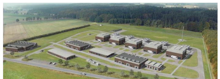
Entwurf Verdichterstation Brackel der GasUnie

Wenn auch jede der hier erwähnten Maßnahmen für sich isoliert betrachtet statthaft erscheinen mag, so ergibt sich aus den kumulierten Belastungen ein erdrückendes Bild für Brackel: